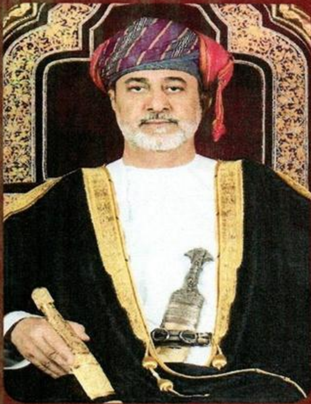
حضرة صاحب الجلالة السلطان هيثم بن طارق المعظم -حفظه الله ورعاه-