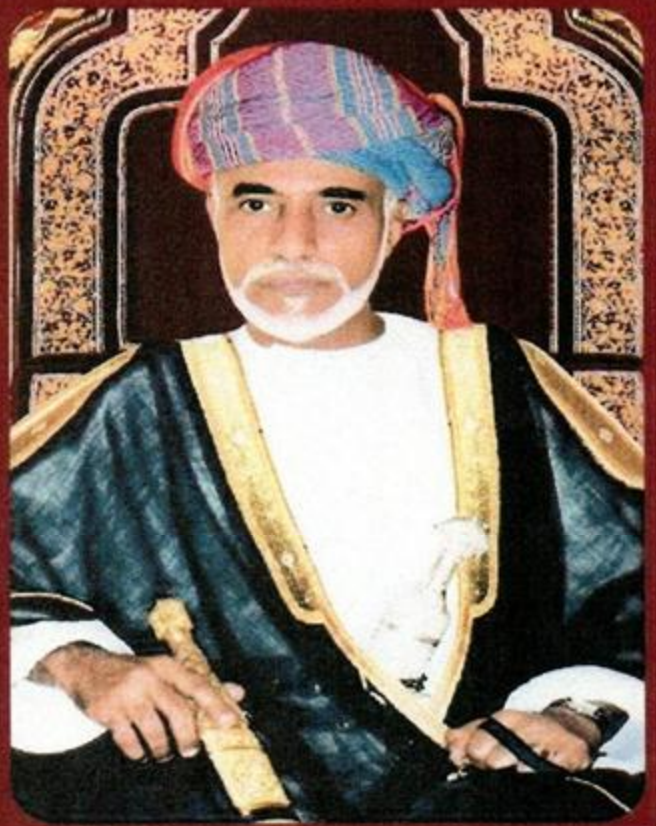
حضرة صاحب الجلالة السلطان قابوس بن سعيد بن تيمور -طيب الله ثراه-